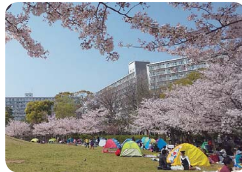
満開の若潮公園の桜