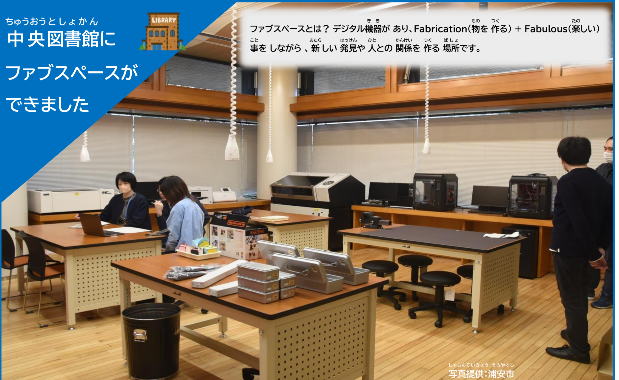
じゃしんていきょう:うらやすし 写真提供:浦安市

ファブスペースとは？ デジタル機器があり、Fabrication(物を作る) + Fabulous(楽しい) 事をしながら、新しい発見や人との関係を作る場所です。