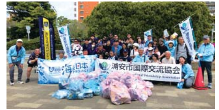
第4回プロウォーキングの集合写真