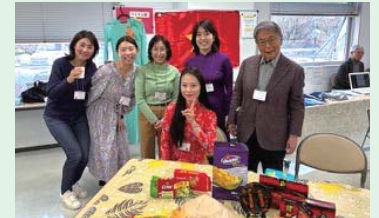
韓国語とベトナム語のフレンドリー・チーム

2025年度前期（4月～9月）外国語講座の受講者募集を次の段階に分け、実施しました。