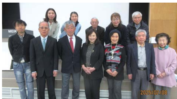
UIFA 創立 35 周年記念事業本部実行委員メンバー