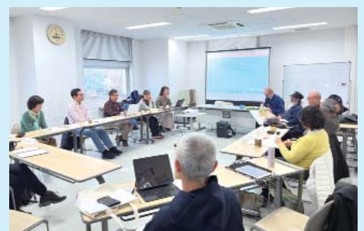
対面テーブルで活発なディスカッションの様子