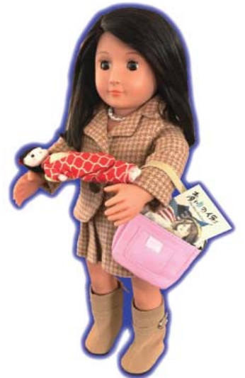
オーランド・浦安姉妹都市委員会より 寄贈された「Miss Shoko」人形